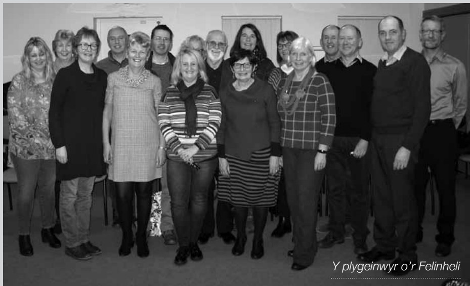
Y plygeinwyr o'r Felinheli