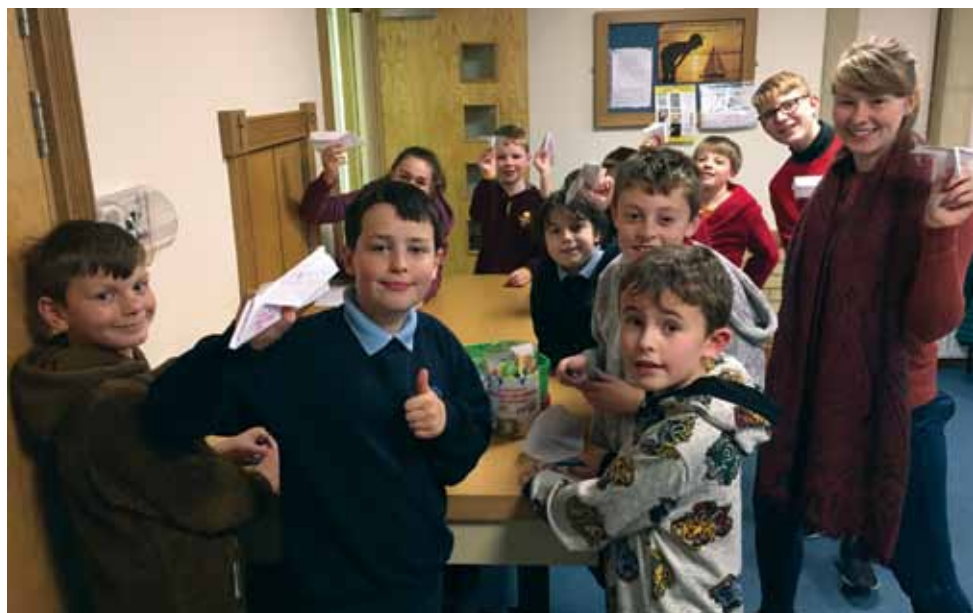
Codi pres at Blant Mewn Angen ym Merea ac (isod) ym Methania