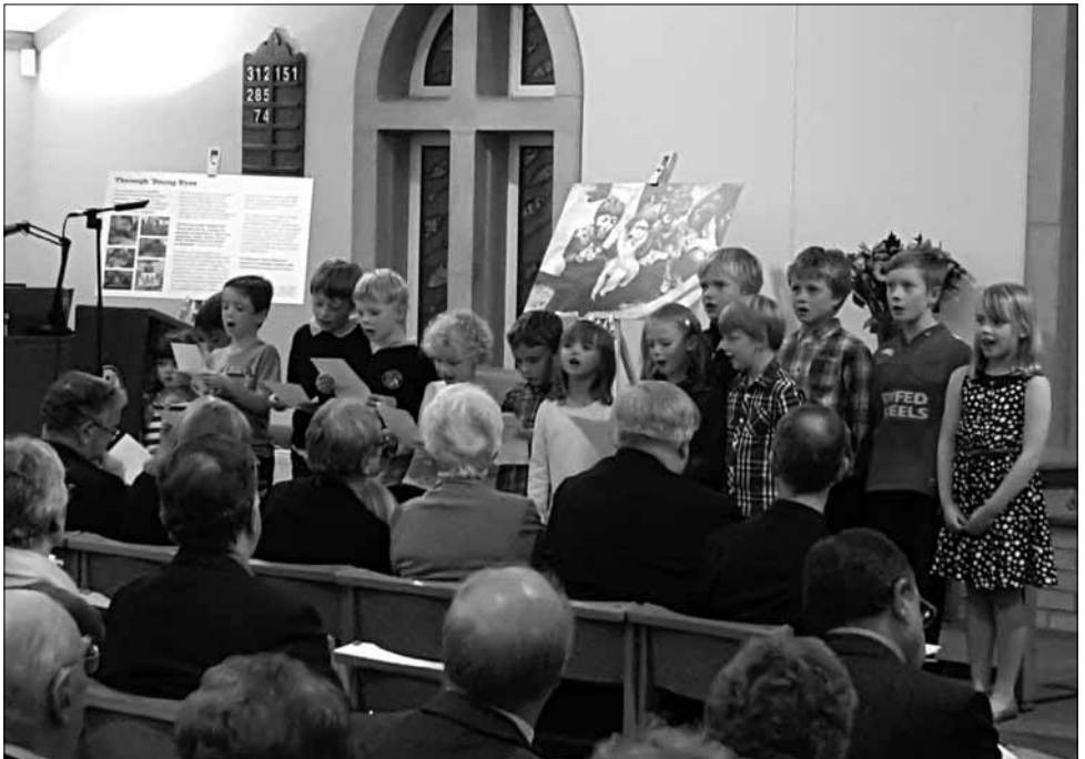
Rhai o'r plant yn diddanu yn ystod y Cyfarfod Sefydlu

Tynnwyd y gwasanaeth i'w derfyn gan y Parch Edwin Hughes, un arall sydd yn adnabod Elwyn Richards yn dda. Llongyfarchodd y gweinidog ar ei benodiad a diolchodd i bawb am wasanaeth bendithiol. Dymunodd bob bendith i'r ofalaeth a nododd y croeso amlwg a'r gefnogaeth oedd yn bodoli'n barod. Mewn gair wrth y gynulleidfa, gofynnodd iddynt edrych ar ei ôl gan eu sicrhau fod ganddynt weinidog galluog a doeth tu hwnt a'i fod hefyd yn dipyn o gymêr. Sicraodd bawb y bydd yn gweithio'n ddi-baid trostynt ond i bawb gofio, mewn swydd sydd yn '24 x 7', fod rhaid cofio am y balans.